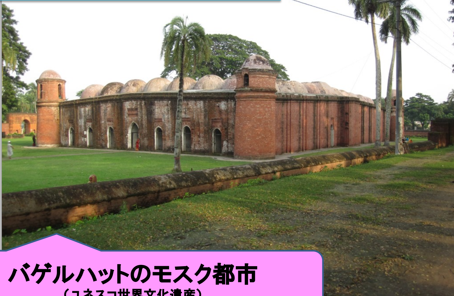
バゲルハットのモスク都市 (ユネスコ世界文化遺産)

バゲルハットには、15世紀にこの地方を開発したカン・ジャハン王によってつくられたモスク群があります。写真は、屋根の上に大小60のドームをつけているシャイト・ゴンブス・モスクです。