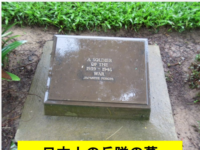
日本人の兵隊の墓