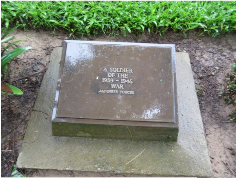
日本人の兵隊の墓